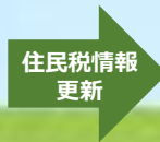
2021年秋の在学採用に申し込んだとき